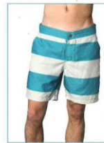
zwemshort boven de knie