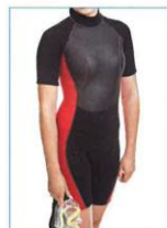
aansluitend pak uit één stuk