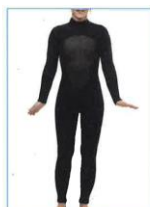
aansluitend pak uit één stuk